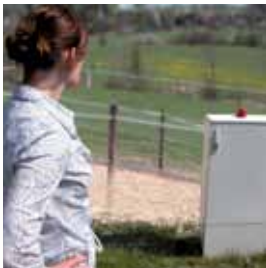
täglich: Überprüfung der Anlage auf Funktion