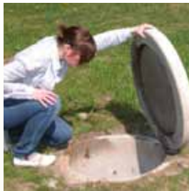
monatlich: Sichtkontrolle mit Öffnen des Schachtdeckels