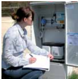
monatlich: Betriebsbuch führen